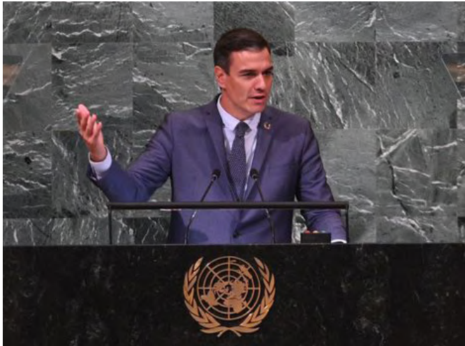
El presidente del gobierno español en un discurso en la Asamblea de Naciones Unidas.- Nueva York, 18-09-2023.