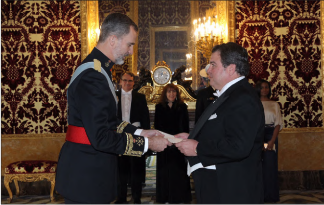
SM el rey recibe la Carta Credencial de manos del embajador de los Estados Unidos de América, Richard Duke Buchan III.- Palacio Real de Madrid, 18 de enero de 2018.