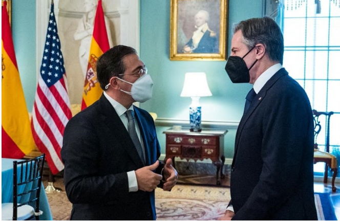
El ministro de Asuntos Exteriores, UE y Cooperación, José Manuel Albares, y el secretario de Estado, Antony Blinken, durante su encuentro en Washington.-18/01/2022.