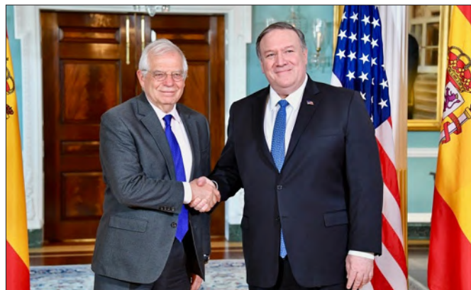
Encuentro celebrado entre el entonces ministro de Asuntos Exteriores, Unión Europea y Cooperación, Josep Borrell con su anterior homólogo estadounidense, Mike Pompeo en EE.UU. - 2 de abril de 2019.- Foto: Departamento de Estado

Las cifras españolas no coinciden con las americanas porque, entre otras cosas, estas últimas incluyen tanto las operaciones ETVE como las NO ETVE. La mayoría de las empresas de matriz española se encuentran establecidas en Florida, debido a razones de afinidad idiomática y cultural y porque en algunos casos lo utilizan de plataforma de entrada a zonas de Hispanoamérica. No obstante, las inversiones más recientes se han distribuido de forma más