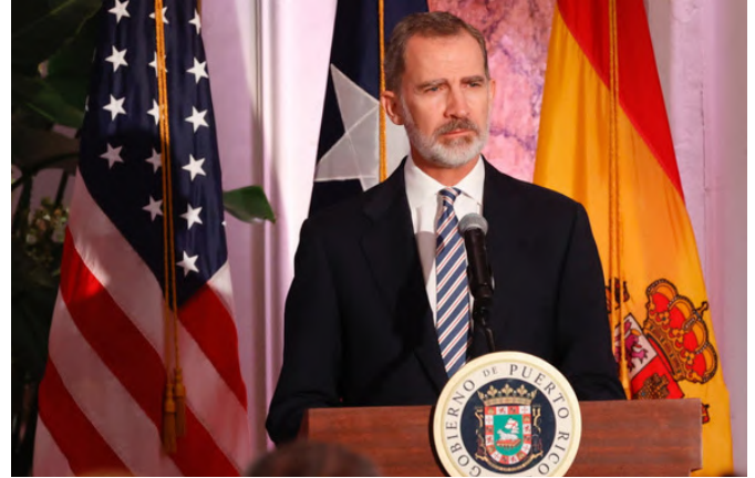
Su Majestad el Rey durante su intervención en la cena.-Puerto Rico.-24/01/2022.-foto: © Casa de S.M. el Rey

riormente hasta los 9.521,4 millones de 2022. En los 9 primeros meses de 2023, los flujos de IDE de EEUU en España alcanzaron los 6.465 millones, un 25,2% menos que en el mismo periodo de 2022. Los principales sectores receptores de la inversión de EE. UU. en lo que va de año, la inversión se ha concentrado en: extracción de crudo de petróleo y gas natural (52,59% del total) y actividades sanitarias (27,13%).