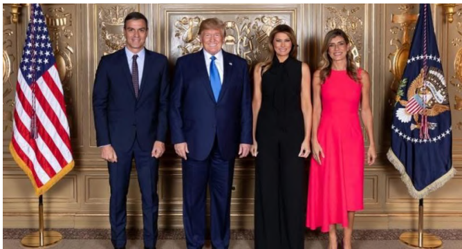
Imagen ofrecida por la Casa Blanca del entonces presidente del Gobierno en funciones, Pedro Sánchez, y su esposa, Begoña Gómez, junto al anterior presidente de EE.UU.

Donald Trump y su mujer, Melania. Durante la recepción de la Asamblea General de la ONU.- Septiembre 2019.