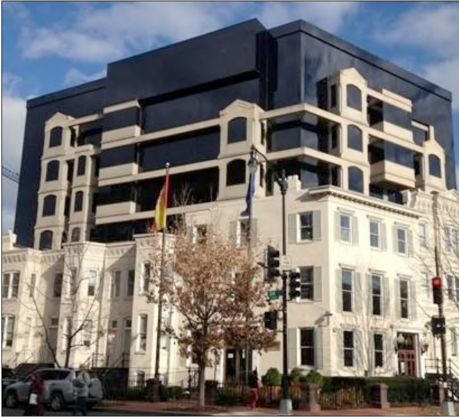
Fachada de la Embajada de España en Washington