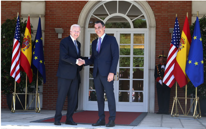
El presidente del Gobierno español, D. Pedro Sánchez, junto al presidente de Estados Unidos, Joe Biden.- Madrid 28-06-2022.