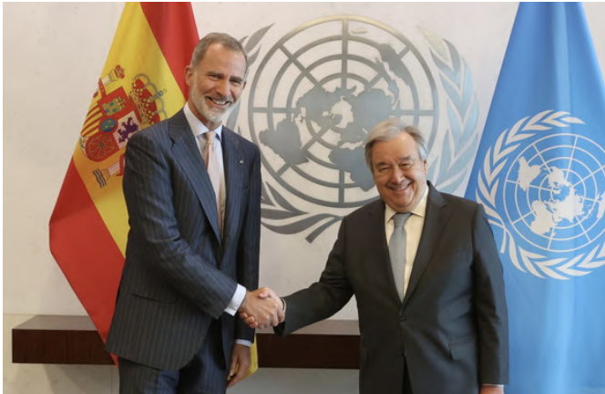
SM el Rey Felipe VI, recibe el saludo del Secretario General de Naciones Unidas, Antonio Guterres.-Nueva York (EE.UU), 20/07/2023.

Otro ejemplo de colaboración es el acuerdo entre las respectivas agencias de cooperación para el desarrollo (USAID Y AECID) a propósito del establecimiento de un almacén de ayuda humanitaria en el puerto de Las Palmas.