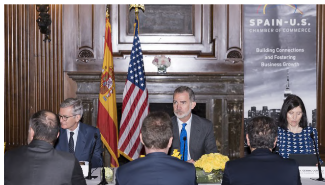
SM El Rey Felipe VI junto a miembros de la Cámara de Comercio España- EE.UU.- Nueva York 26-05-2022.