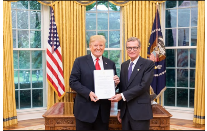
D. Santiago Cabanas Ansorena, Embajador de España en Estados Unidos, presenta sus cartas credenciales ante el entonces presidente, Donald Trump el 17 de septiembre de 2018.

En noviembre de 2023, el presidente Biden reunió en la Casa Blanca a los líderes de los 11 países que participan en la iniciativa APEP "Alianza para la prosperidad económica en las Américas": Barbados, Canadá, Chile, Colombia, Costa Rica, Rep. Dominicana, Ecuador, México, Panamá, Perú y Uruguay) lanzada en la Cumbre de las Américas para aumentar las oportunidades y disminuir la desigualdad, para aprovechar el increíble potencial eco-